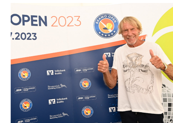
Carlo Thränhardt ist bei den BRAWO OPEN.

Er ist mehrfacher Weltrekordhalter und Europameister im Hochsprung, Mentalcoach, Fitness- und Athletiktrainer des Deutschen Davis Cup-Teams: Carlo Thränhardt. Auf Einladung der Braunschweiger Privatbank besucht er bis Turnierende die diesjährigen BRAWO OPEN. Das Fazit seines Besuchs: „Für Deutschland und die Welt sind die BRAWO OPEN ein besonderes Turnier.“ Der 66-Jährige ist braun gebrannt, immer noch top-fit und absolviert jeden Morgen Barfuß-Steigerungsläufe. Er coacht nicht nur Firmen- und Führungskräfte, sondern auch deutsche Top-Tennis-Spieler wie Altmaier, Struff und Zverev als Motivations- und Mentalcoach. Sein Tipp für jeden: Eine positive Grundeinstellung ist der Schlüssel zu jedem Erfolg.