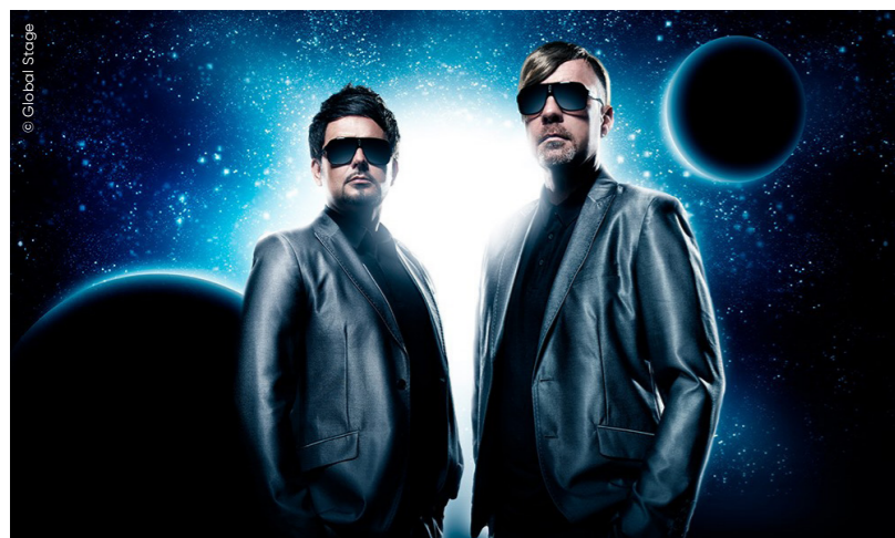
The Disco Boys: Ihre weltweite Hit-Single „For You“ aus dem Jahr 2005 war mehr als fünf Jahre fast ununterbrochen in den Media Control Top 100 Single Charts vertreten.