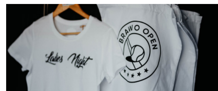
Mit diesem Shirt steht Ihr Outfit für unsere Ladies Night.

drucken wie „Volleygott“, „Love Tennis“ oder „Ladies Night“. Schweißbänder, die bei der andauernden Hitze helfen, gibt es ebenfalls. Genauso können Sie Ihren Lieben Kuscheltiere als Andenken mitbringen. Sie sehen: Mit unseren vielfältigen Merchandising-Artikeln können Sie sich als echten Fan der BRAVO OPEN outen und haben gleichzeitig eine schöne Erinnerung an das Turnier.