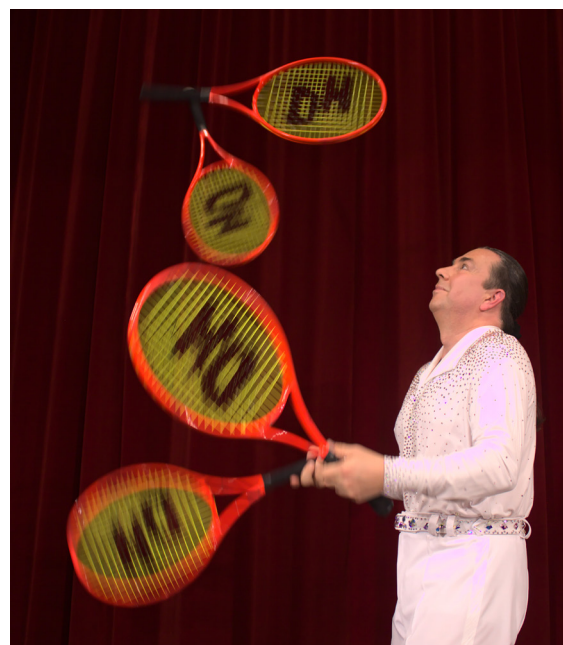
Vier Tennisschläger fliegen durch die Luft.